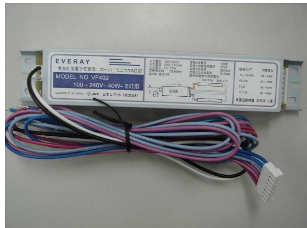
日本エヴァレイ株式会社 電子安定器 ローハーマモニック AC 型 MODEL NO VF402 100~240V-40W-2 灯用