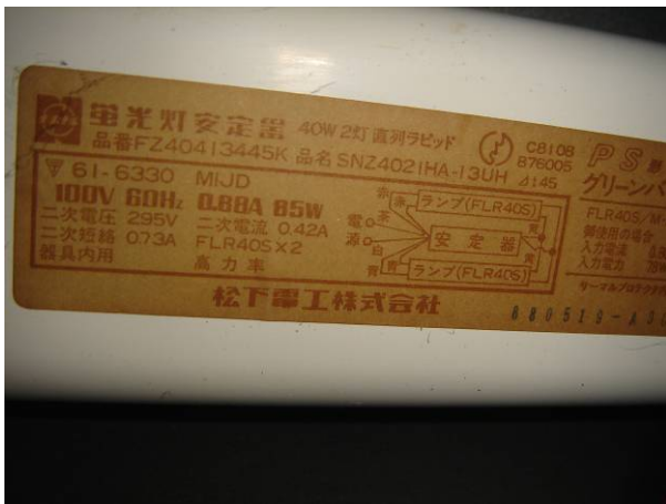
松下電工株式会社 PS 形 蛍光灯安定器 40W 2 灯用 直列ラピッド 品名 SNZ402IHA-13UH